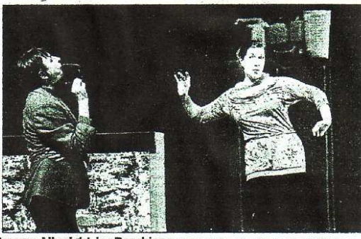
« Bizet était une femme » (Cie La Rumeur), Nicolas Canteloup, Graeme Allwright, les Deschiens.